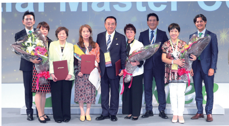
新設 プレジデンシャルマスターコーディネーター