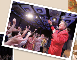
ダンスダンスダンス!!