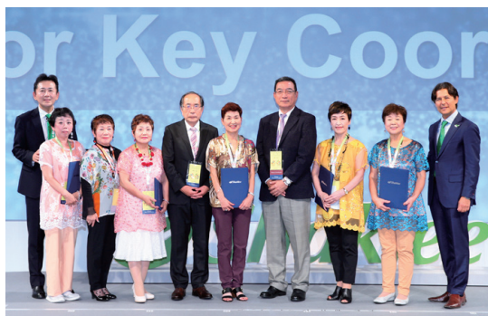
シニアキーコーディネーター