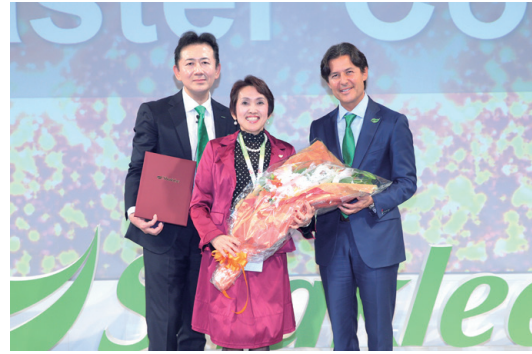
新設 シニアマスターコーディネーター