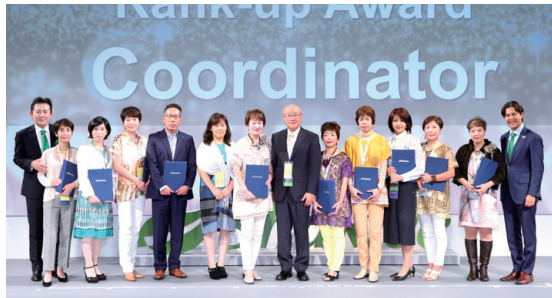
コーディネーター

グループの構築を着実に実践し昇格を果たされた方々に、会場から大きな拍手が贈られました。