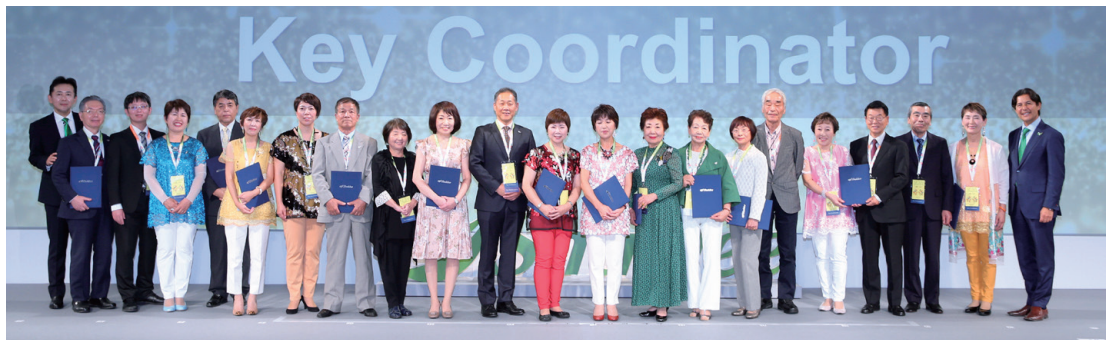
キーコーディネーター