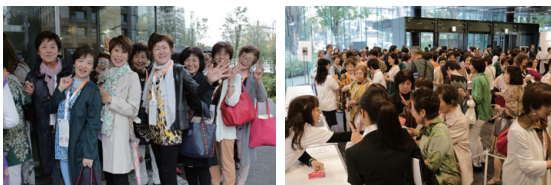
8:30の開場を待つファミリーの皆さま。早朝からこの笑顔！