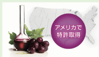
「ヴィヴィエクス シークレット」より