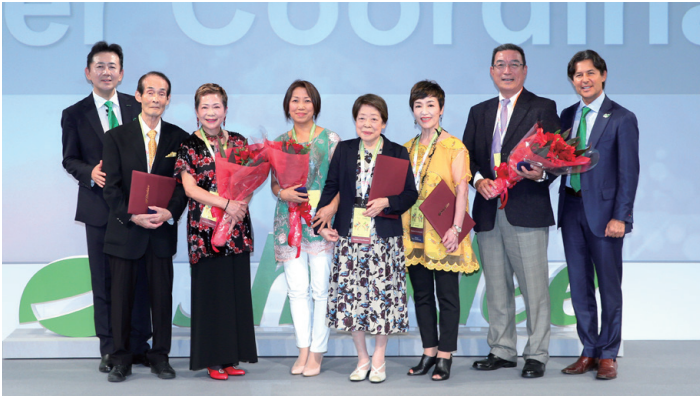
マスターコーディネーター

ファミリーの憧れ、マスターコーディネーター、シニアマスターコーディネーター、プレジデンシャルマスターコーディネーターのトップオブザトップの皆さんでリコグニションセレモニーが締めくくられました。