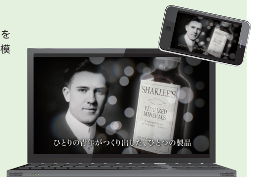
「シャクリー ブランドストーリー」より