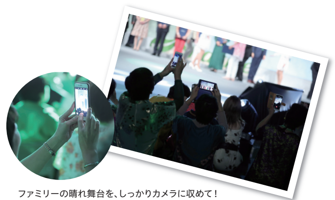
ファミリーの晴れ舞台を、しっかりカメラに収めて！