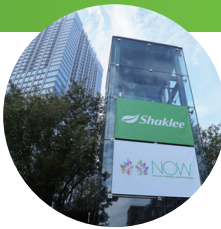
会場はおなじみベルサール高田馬場