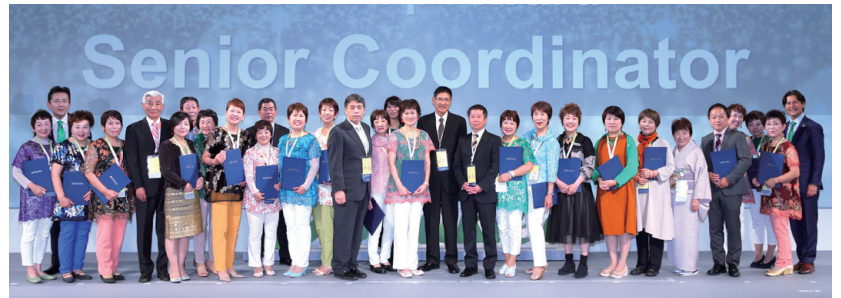
シニアコーディネーター