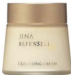
リフェンセル クレンジングクリーム 100g SRP: ¥6,120, SN: ¥4,360