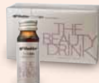
ザ・ビューティドリンク