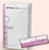
シャクリー コラーゲン パウダー