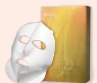
プレミアム マスク 3D